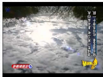
連橫的鴉片特許討論