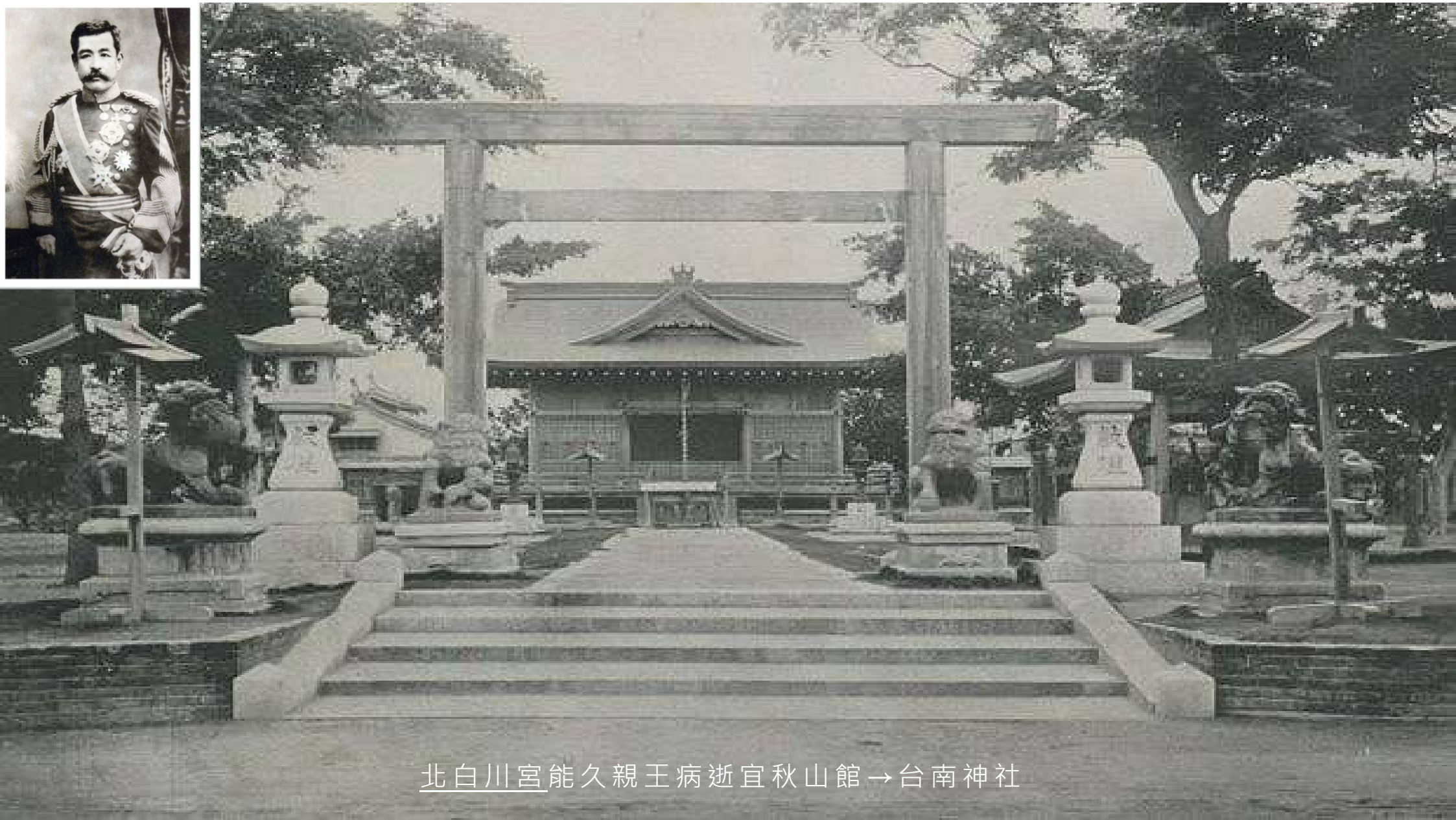
北白川宮能久親王病逝宜秋山館→台南神社