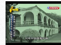
連橫的工作與成就