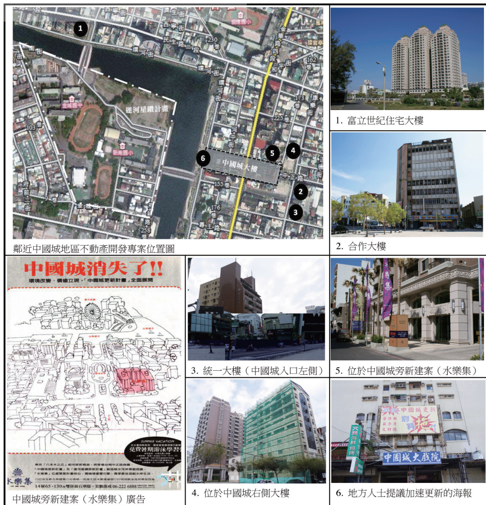
圖三 中國城都市更新計畫鄰近不動產開發案