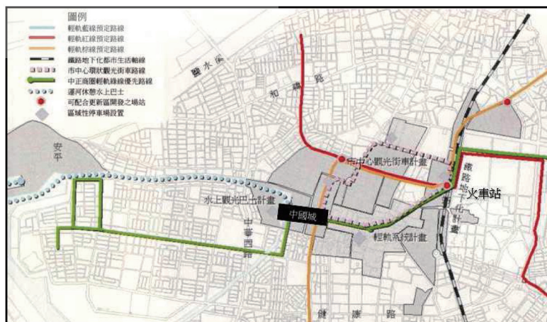
圖一 臺南市中國城都市更新計畫位置圖