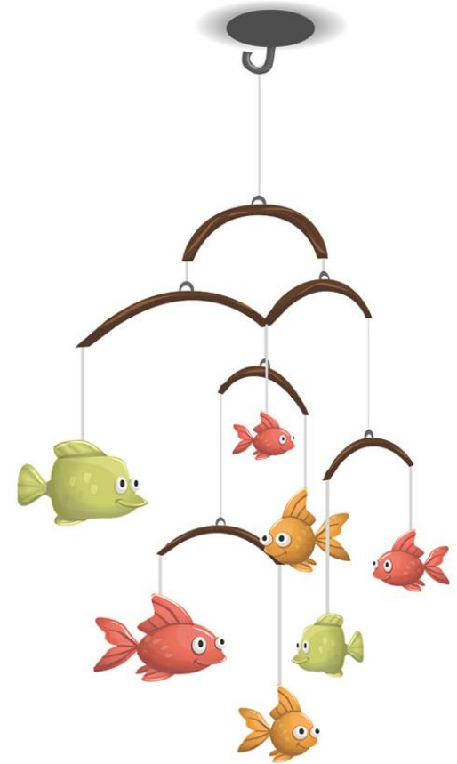
圖 10-1 家庭的運作有如「連動吊飾」，牽一髮動全身